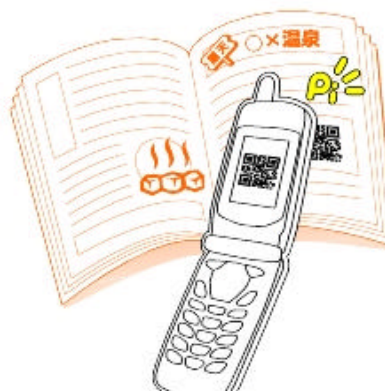
2次元コード読み取り