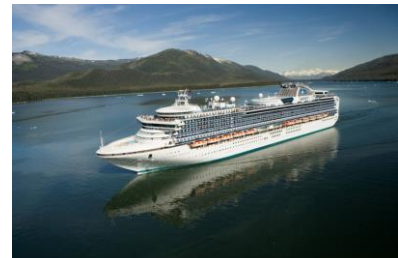
客船「ダイヤモンド・プリンセス」

クルーズ名: ゴールデンウィーク 日本周遊と釜山11日間 舞鶴寄港日: 2014年4月30日