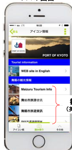
観光案内 (英・中・韓・露)