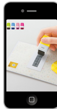
商品ムービー再生