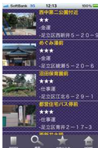
スポットリスト画面