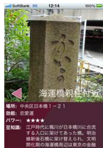
実際のパワースポット詳細画面