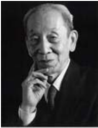
One peaceful world Michio Kushi 久司道夫